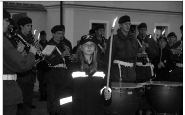
Fackelträger bei der Bundesheer-Angelobung in Oritzberg

Derzeit besteht unsere junge Truppe aus 11 Mitgliedern: